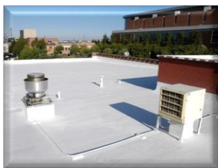
Кровля после нанесения материала

Эффективно отражает солнечные лучи, препятствует нагреву крыши.